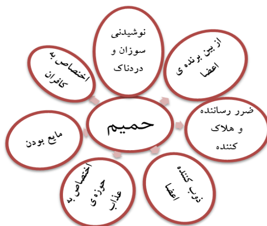
شکل ۲. مؤلفه‌های معنایی حمیم